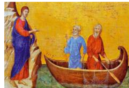
La crida dels apòstols Pere i Andreu (1308), de Duccio di Buoninsegna. Galeria Nacional d'Art, Washington (EUA)