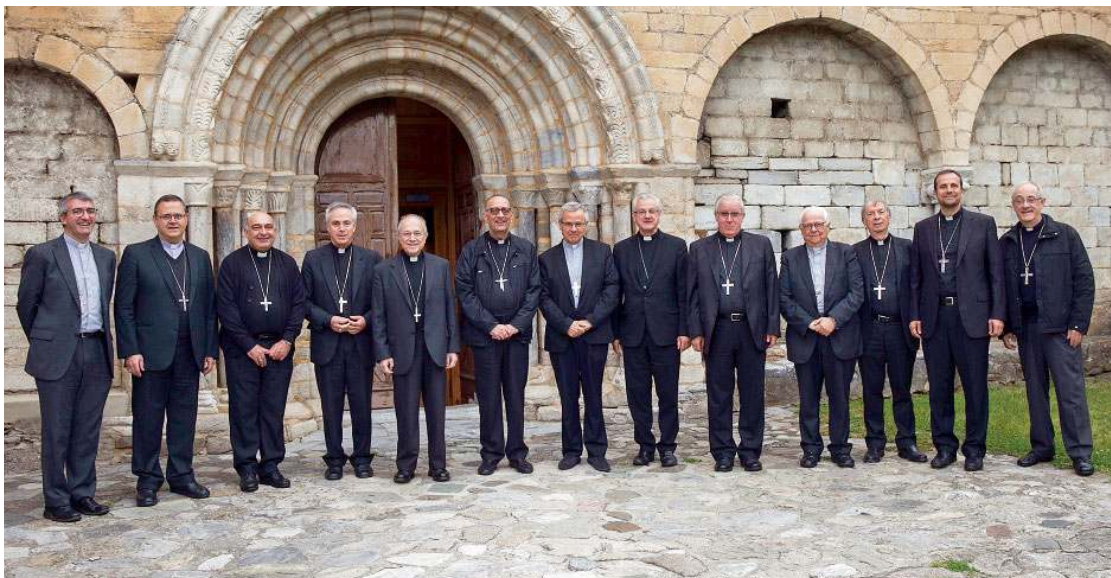
Els actuals bisbes de les diòcesis amb seu a Catalunya en una imatge de la reunió de la Tarraconense celebrada a Salardú, el passat mes de juliol

El concili fou clausurat solemnement a la catedral de Tarragona el 4 de juny de 1995. En compli-