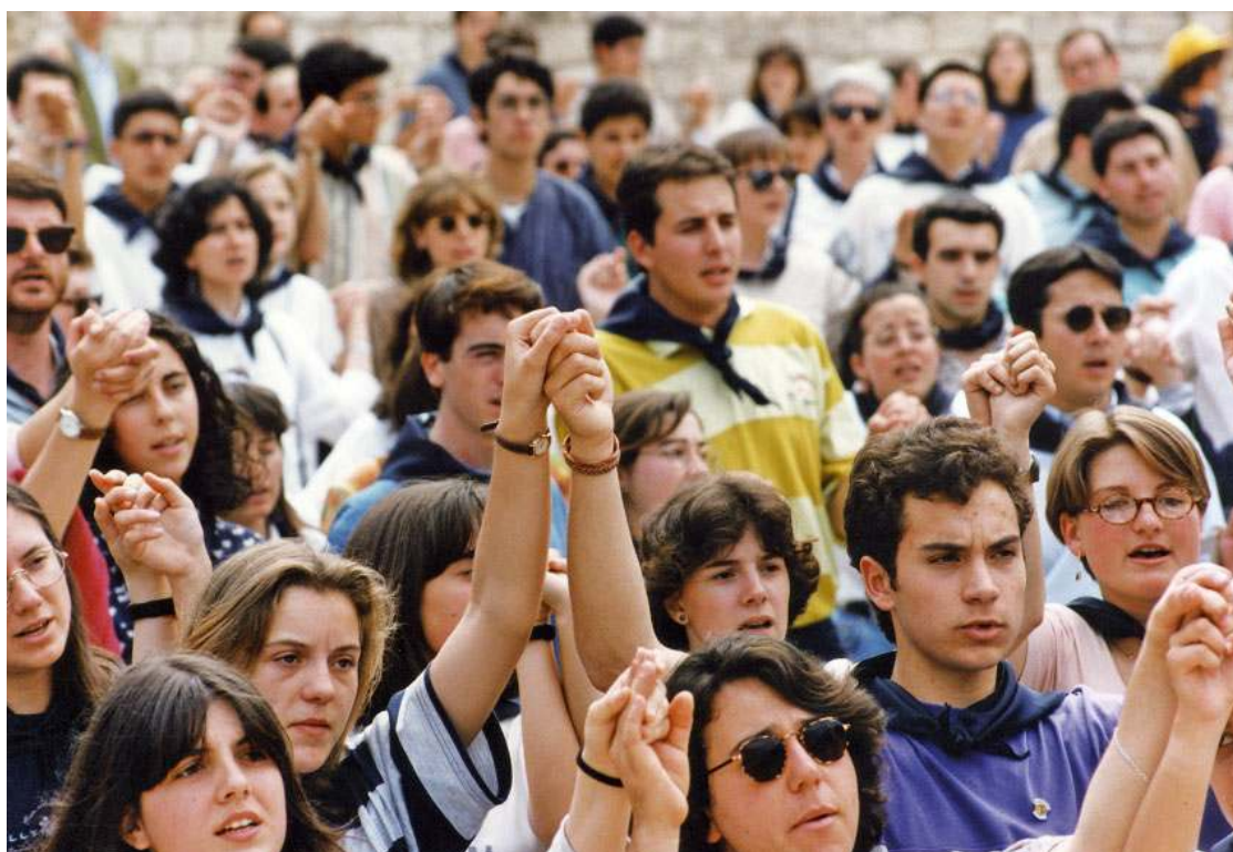
Un grup de joves participa a l'acte de cloenda del Concili Provincial Tarraconense, celebrat el 4 de juny de 1995

Contemplant els seus documents i resolucions, hom s'adona de la seva profunda actualitat. A la llum de l'Evangelí i de l'escolta de la Paraula de Déu, anunciar l'Evangelí a la nostra societat, amb una sol·licitud especial pels pobres, i en un marc d'unitat pastoral de les nostres Esglésies, ha de ser el pernil o el pal de paeller de l'Església d'avui. Per aquest motiu, ens trobem en plena fase de recepció del Concili Provincial de 1995. Amb les degudes condicions d'universalitat de temps i d'espai, la recepció ha d'anar originant un veritable «consensus fidelium»,