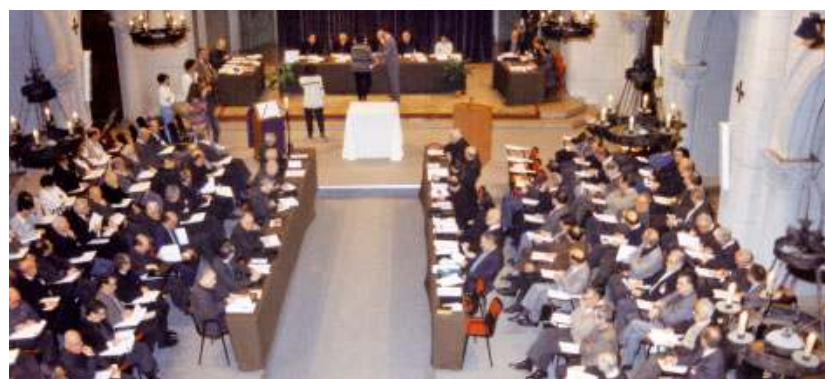
Moment de la cloenda del Concili a l'interior de la Catedral de Tarragona