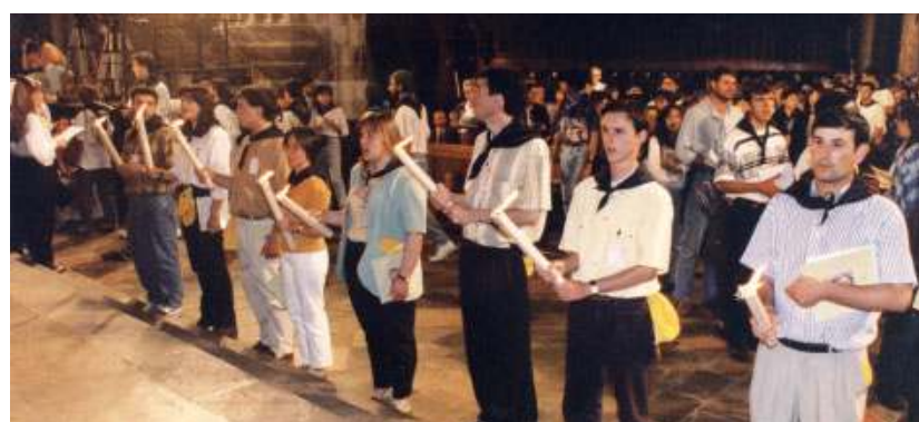
Joves participant en l'acte de cloenda del Concili a l'amfiteatre romà de Tarragona el dia 4 de juny de 1995