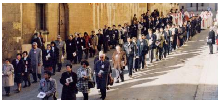
Processó pels carrers de Tarragona. La participació de laics va ser molt important i generosa