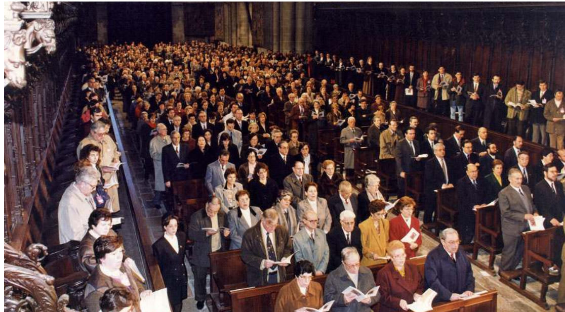
Imatge de la inauguració del Concili Provincial Tarraconense que va tenir lloc el 21 de gener de 1995, a la Catedral Basílica Metropolitana i Primada de Santa Tecla