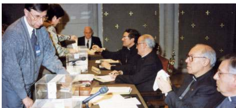
Obertura de les urnes després de les votacions dels temes