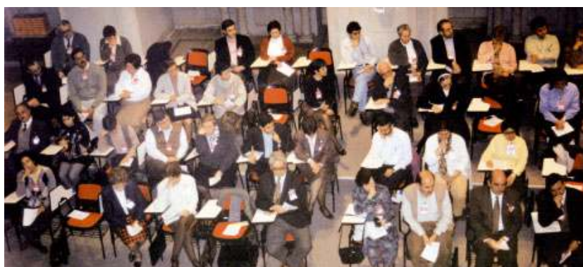
Sessions de treball al Casal Borja de Sant Cugat del Vallès