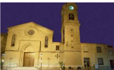
Església de Sant Miquel de Deltebre