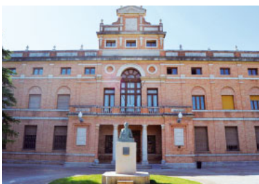
Seminari de Tortosa