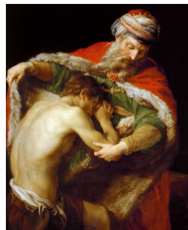
El retorn del fill pròdig (1773) de Pompeo Batoni. Museu d'Història de l'Art de Viena (Àustria)

Ens anem atansant a la Pasqua. La primera lectura fa referència a la primera Pasqua en llibertat del poble d'Israel: Llavors els israelites van celebrar la festa de Pasqua. Des d'aquell dia ja no caigué més el manà, el menjar del desert. Ara ja són a la terra promesa; ja s'ha celebrat el pas (la Pasqua) de l'esclavitud a la terra promesa.