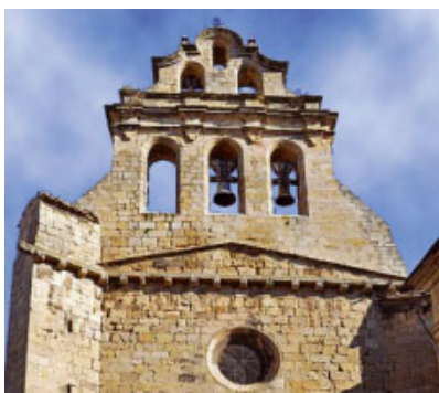
Església parroquial de St. Joan Baptista d'Horta de Sant Joan

Del 9 al 17 de març , parròquia d'Horta de Sant Joan, a les 19.30 h, Novena de Sant Salvador.