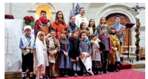
Nadal a Vilalba dels Arcs

E ls xiquets i xiquetes de La Fatarella i Vilalba dels Arcs van oferir una representació del naixement de Jesús durant la celebració de la Misa del Gall del passat Nadal. Ens van acompanyar