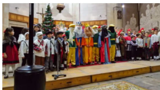
Nadal a La Fatarella