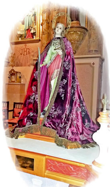
Santa Lucía Olocau del Rey

Son días llenos de actos, donde no faltan festejos de todos los tipos: musicales y artísticos así como religiosos. Con la Eucaristía del Domingo de fiestas y posterior procesión de la santa por las principales calles del municipio se honra a la patrona del municipio.