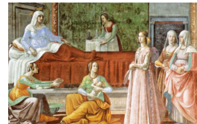
Naixement de sant Joan Baptista (s. XV) de Domenico Ghirlandaio

E l 2n Càntic del Servent de Déu presenta un personatge amb missió universal: els pobles llunyans .