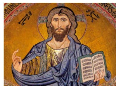
Pantocràtor (s. XII) mosaic bizantí de la catedral de Cefalú (Sicília, Itàlia)

La secció cp. 33-37 d'Ez anuncia la restauració del desterrat Israel. Recordant-ne la causa, pronuncia oracle d'amenaça (v. 8s) contra els pastors del ramat de Déu que, en comptes de pasturar-los, es pasturen a ells mateixos .