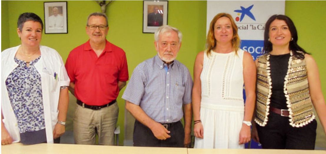
Residència diocesana d'Ancians «Sant Miquel Arcàngel»