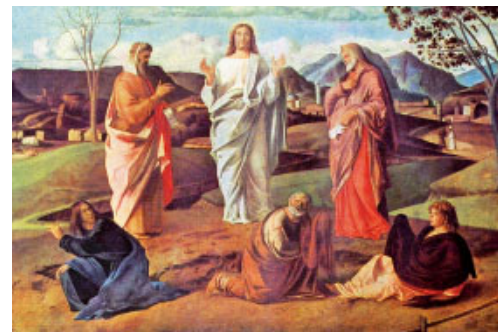
La Transfiguració (1479) de Giovanni Bellini. Museu Nacional de Capodimonte, Nàpols (Itàlia)

E l llibre de Dn és de gènere literari apocalíptic.