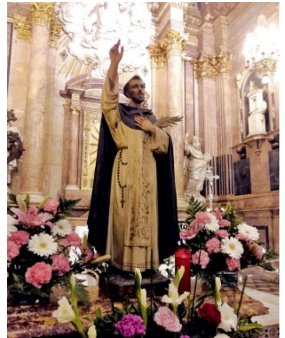
Delegació de Missions

En acabar vam compartir un dinar de germanor. Fou una festa del nostre patró molt reeixida.