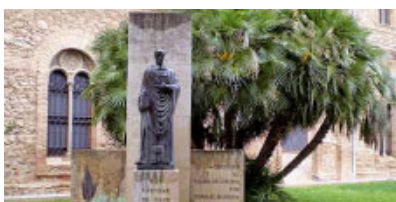
Centre Sant Enric d'Ossó