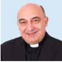
† Enrique Benavent Vidal Obispo de Tortosa

E l 13 de noviembre celebramos la Jornada de "Germanor". Esta jornada anual pretende ser una contribución a fortalecer y vigorizar nuestro sentimiento de pertenencia a la Iglesia diocesana. Todos formamos parte de la Iglesia universal por medio del Pueblo de Dios que vive en una Iglesia particular, en nuestro caso en la Iglesia diocesana de Tortosa. En ella hemos recibido el bautismo que nos hace Hijos de Dios, celebramos los sacramentos recibiendo el alimento de vida eterna en la Palabra y la eucaristía, especialmente, y vivimos la caridad en el servicio a los hermanos, de un modo particular en los más necesitados.