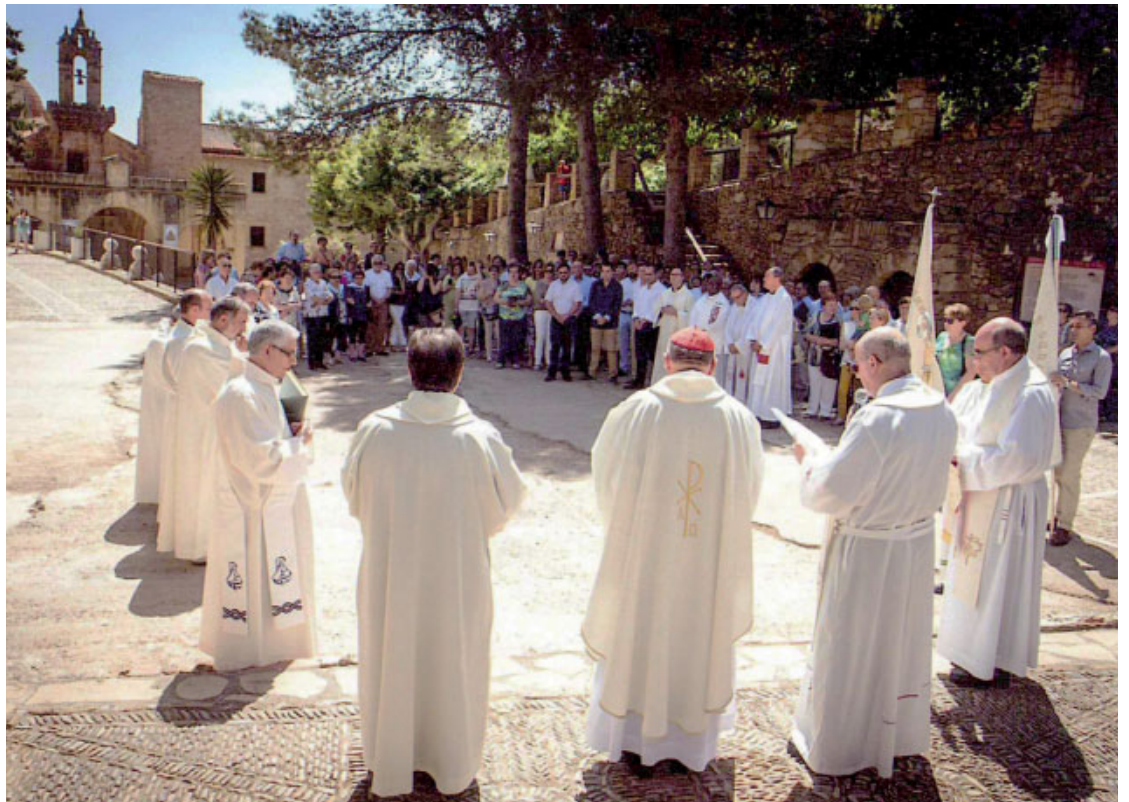
El Sr. Bisbe va signar al llibre de visites, davant dels alcaldes, veïns i regidors que representaven els Alcaldes que no van poder assistir-hi el dia 25

També vàrem veure uns llibres antics de part de l'Ajuntament (segle XVIII).