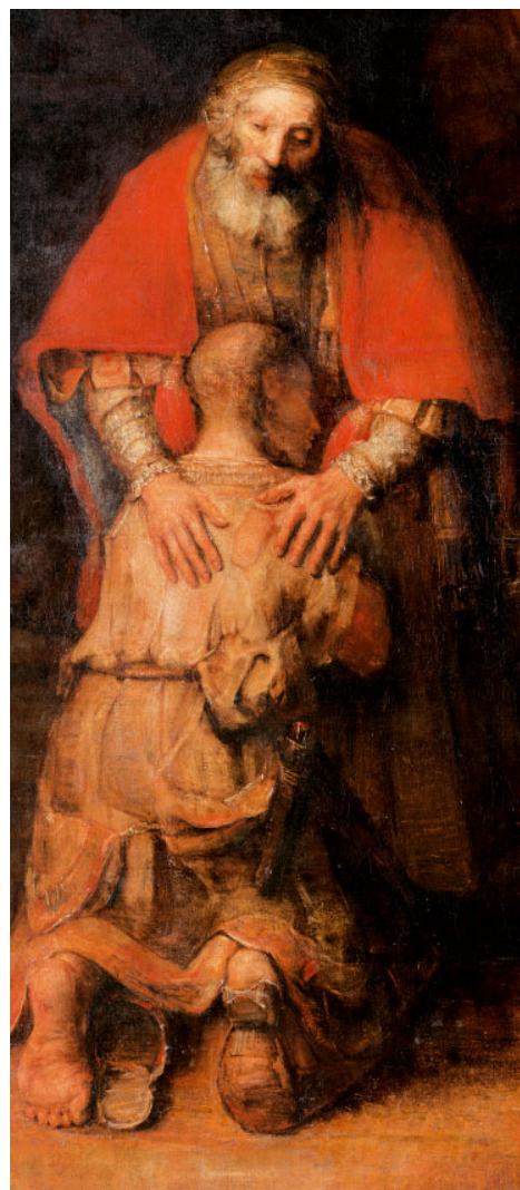
sa, sinó perquè tenim la dignitat de fills responsables.

El fill gran, ell també necessita misericòrdia. Aquest fill ens representa a nosaltres quan ens preguntem si val la pena cansar-se tant si després no rebem res a canvi. Jesús ens recorda que a la casa del Pare no s'hi està per a tenir després una recompen-