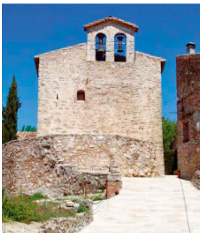
Església romànica de Llaberia