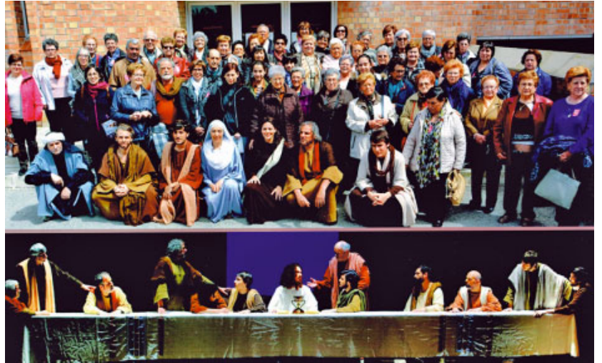
A la part superior el grup de Mans Unides amb alguns actors i a la part inferior una escena de La Passió d'Esparreguera