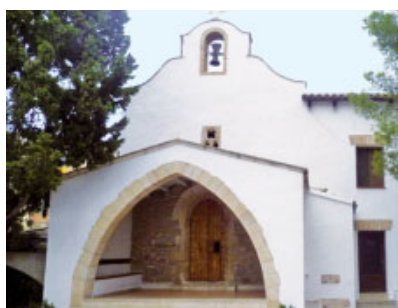
Ermita de la Mare de Déu de la Petja