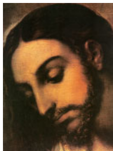
Rostre de Crist. Fragment d'una pintura atribuïda a Francesc Ribalta. Capella de les Religioses Agustines, Sogorb

La maldad da muerte al malvado, / y los que odian al justo serán castigados. / El Señor redime a sus siervos, / no será castigado quien se acoge a él. R.