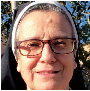
Aquesta imatge parla