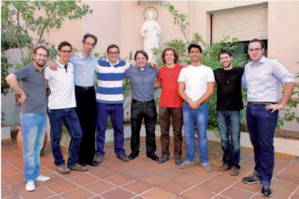
Feia anys que no hi havia tantes noves incorporacions als seminaris catalans: gairebé una trentena. No es vol parlar encara de revifalla vocacional, però és un signe esperançador que ha donat ànim als bisbes i als responsables dels seminaris. La majoria són joves que ronden els vint anys i alguns, amb més anys, amb la carrera acabada. Són un signe d'esperança per a les diòcesis catalanes. Foto: Alumnes del Seminari Interdiocesà.