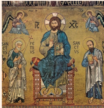
Jesucrist amb sant Pere i sant Pau. Capella Palatina (s. XII), Palermo

Y estos irán al castigo eterno, y los justos a la vida eterna.»