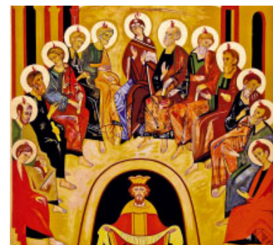
Corona Misterica, Pentecosta (2004), de Kiko Argüello. Catedral de l'Almudena de Madrid

Els jueus a Pentecosta donaven gràcies a Déu: primer pel do de la collita i des del s. II aC pel gran do de l'Aliança.