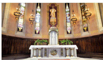
Temple de la Reparació (Tortosa)