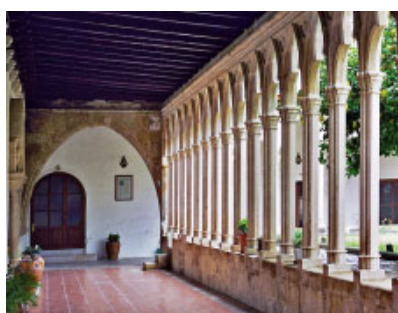
Monestir de Santa Clara (Tortosa)