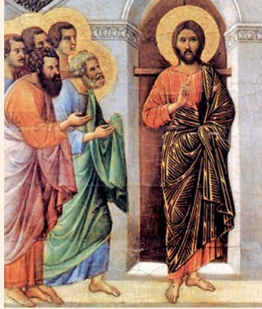
Aparició de Jesús ressuscitat als Apòstols. Panell de la Maestà de Duccio, Catedral de Siena

En paz me acuesto y en seguida me duermo, / porque tú solo, Señor, me haces vivir tranquilo. R.