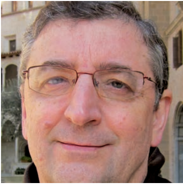
Aquesta imatge parla