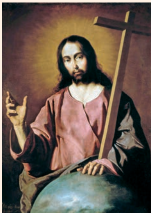
El Salvador beneito. Pintura de F. Zurbarán (1598-1664), Museu del Prado (Madrid)

»Ahora mi alma está agitada, y ¿qué diré?: Padre, líbrame de esta hora. Pero si por esto he venido, para esta hora. Padre, glorifica tu nombre.» Entonces vino una voz del cielo: «Lo he glorificado y volveré a glorificarlo.» La gente que estaba allí y lo oyó decía que había sido un trueno; otros decían que le había hablado un ángel. Jesús tomó la palabra y dijo: «Esta voz no ha venido por mí, sino por vosotros. Ahora va a ser juzgado el mundo; ahora el Príncipe de este mundo va a ser echado fuera. Y cuando yo sea elevado sobre la tierra atraeré a todos hacia mí.» Esto lo decía dando a entender la muerte de que iba a morir.