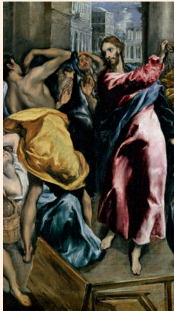
L'expulsió dels mercaders del temple. Pintura d'El Greco (fragment), església de San Ginés (Madrid)

Mientras estaba en Jerusalén por las fiestas de Pascua, muchos creyeron en su nombre, viendo los signos que hacía; pero Jesús no se confiaba con ellos, porque los conocía a todos y no necesitaba el testimonio de nadie sobre un hombre, porque él sabía lo que hay dentro de cada hombre.