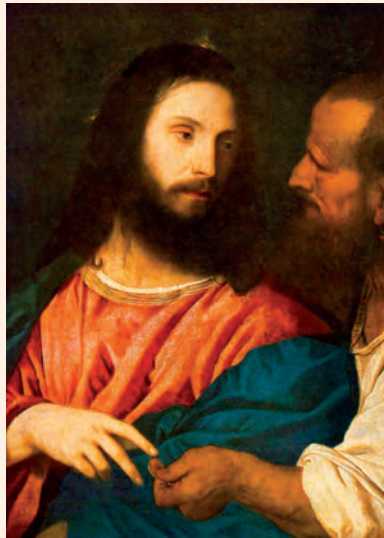
Jesús i un fariseu que li pregunta sobre el tribut al Cèsar. Pintura de Ticià, Gemäldegalerie (Dresde)

Comprendiendo su mala voluntad, les dijo Jesús: «Hipócritas, ¿por qué me tentáis? Enseñadme la moneda del impuesto.» Le presentaron un denario. Él les preguntó: «¿De quién son esta cara y esta inscripción?» Le respondieron: «Del Cèsar.» Entonces les replicó: «Pues pagadle al Cèsar lo que es del Cèsar y a Dios lo que es de Dios.»